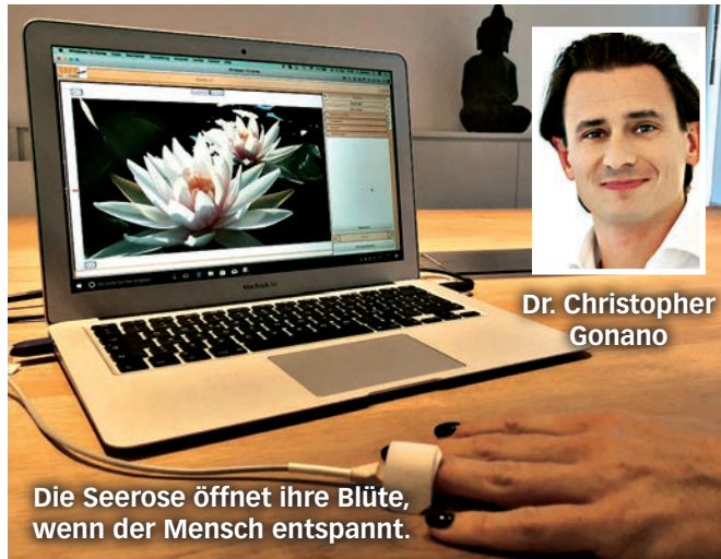
Die Seerose öffnet ihre Blüte, wenn der Mensch entspannt.

Bei einem Biofeedback-Therapeuten kostet eine Sitzung zwischen 70,- und 150,- Euro für fünfzig Minuten. Manche Privatversicherungen übernehmen einen Teil der Kosten.